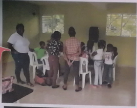
El sábado 4 de mayo, se llevó a cabo un operativo médico con las autoridades de Rehabilitación en la Clínica Rural del Ramón con la colaboración de nuestra Junta Municipal de Hato Damas.